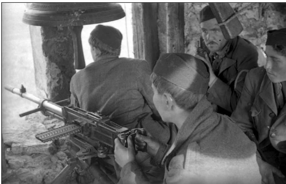
Izvidnica Cankarjeve brigade v cerkvenem zvoniku na Zaplazu nad Čatežem, 11. november 1943