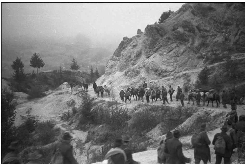
Cankarjeva brigada na pohodu nad Zagradcem, 2. december 1943 (MNZS)