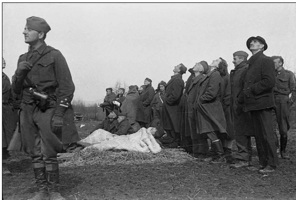
Ranjeni partizani opazujejo pristajanje zavezniških letal, Griblje pri Črnomlju, marec 1945