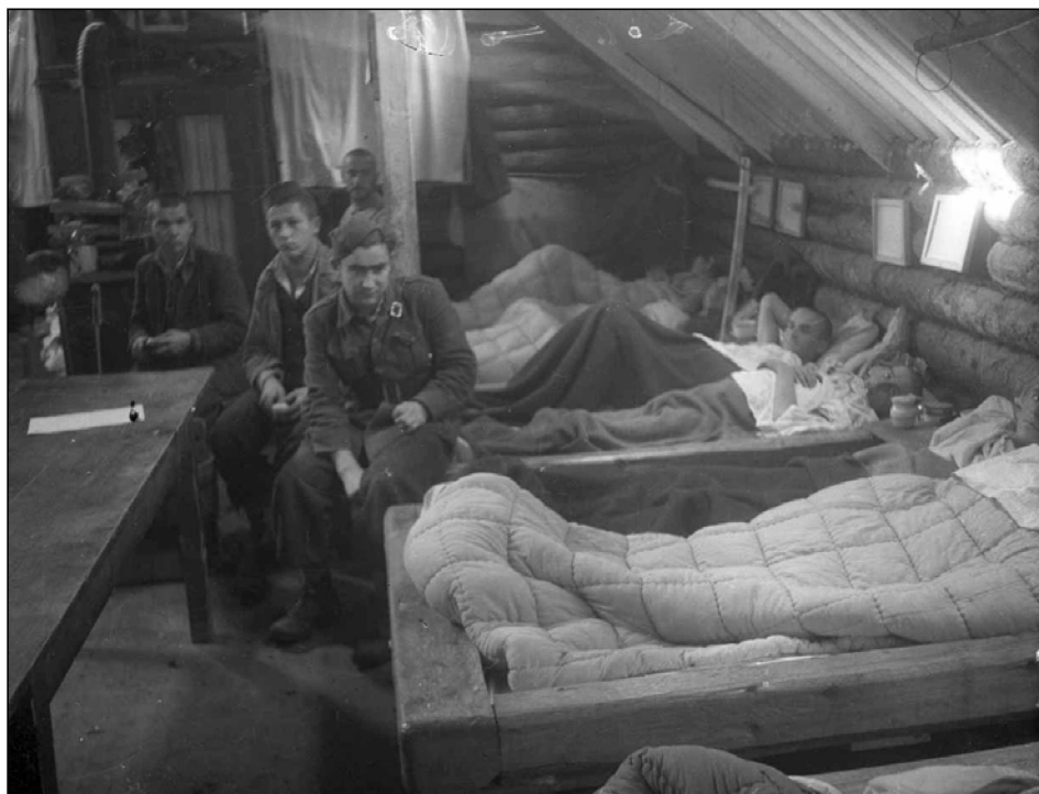
V partizanski bolnici Jelendol, 1944 (MNZS)