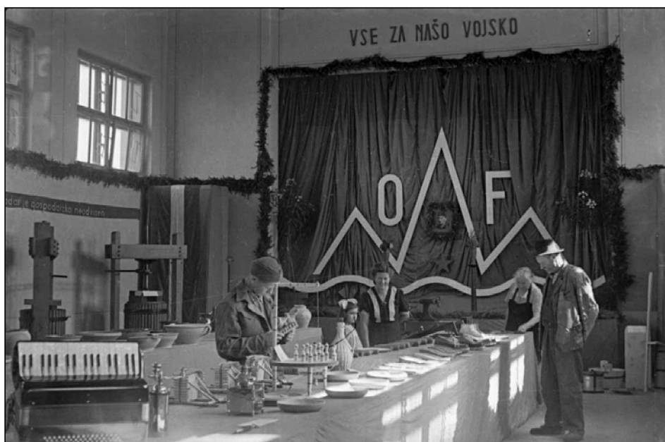
Obrtno-industrijska razstava v Črnomlju od 27. julija do 5. avgusta 1944