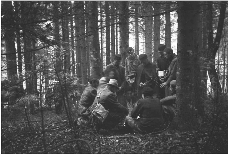
Borci Cankarjeve brigade med nemško ofenzivo na Ilovi gori, 1. november 1943