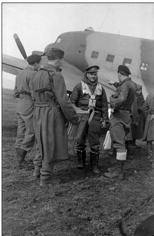
Pogovor angleškega pilota s partizani, Griblje pri Črnomlju, marec 1945 (MNZS)