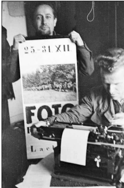
Propagandni letak za napoved fotografske razstave v hotelu Lackner v Črnomlju, december 1944