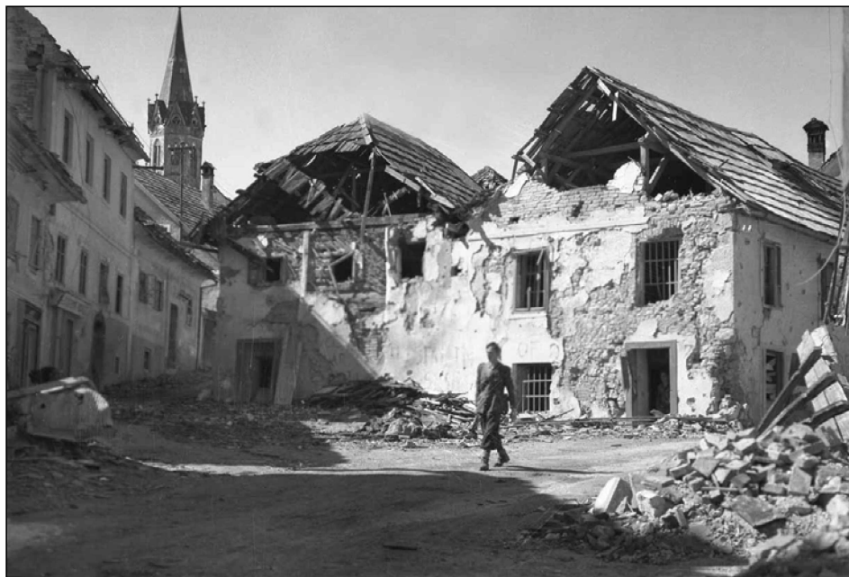
Pogled na Ljubljansko ulico v Novem mestu po prvem bombardiranju, 14. september 1943 (MNZS)

spominjal Veselko. 3 To plodno delo je ustavila ofenziva, ko je nemška vojska vdrila v Novo mesto. Veselko je moral z ostalimi grajsko temnico zapustiti. »Začela se je šesta ofenziva in moral sem se ločiti od fotodelavnice. Samo leče sem hitro odvil s povečevalnika in jih z nekaj filmi vtaknil v krušno torbo. Drug material sem po Brelihovem navodilu skrbno zložil v zaboj, ki so ga člani gospodarske komisije z živežem vred odpeljali do Poloma v Suhi krajini,« 4 se je spominjal tega.