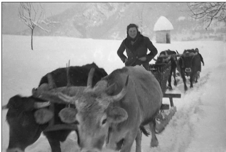
Žene s sanmi vozijo hrano iz garnizije v Predgrad, januar 1945