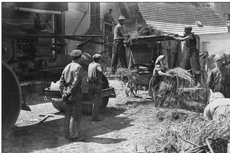
Mlatenje žita, Črnomelj, avgust 1944