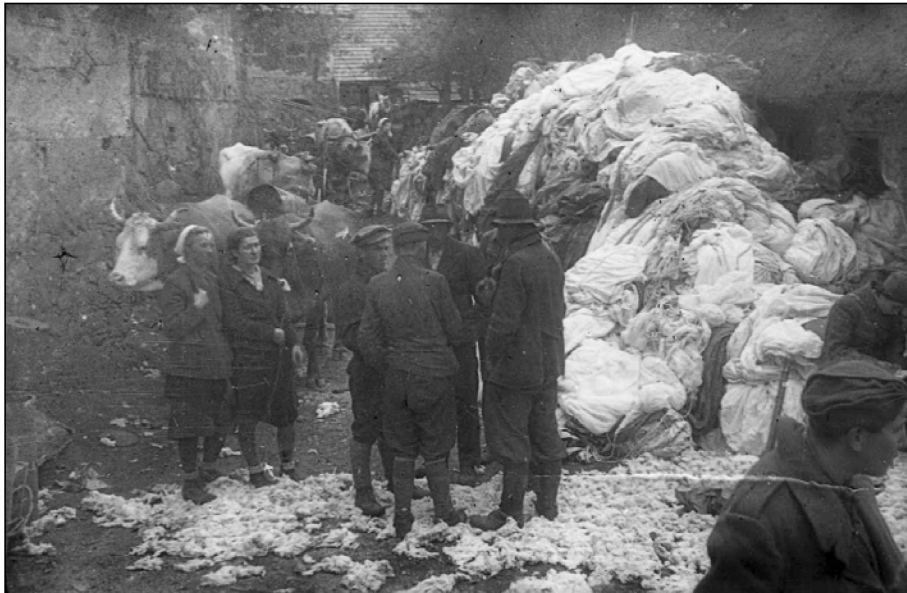
Zavezniška pomoč, Predgrad, 7. november 1944