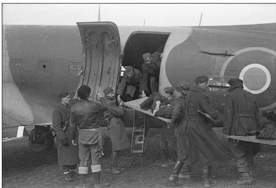
Vkrcavanje ranjencev na zavezniška letala za prevoz v Bari, Črnomelj, marec 1945 (MNZS)