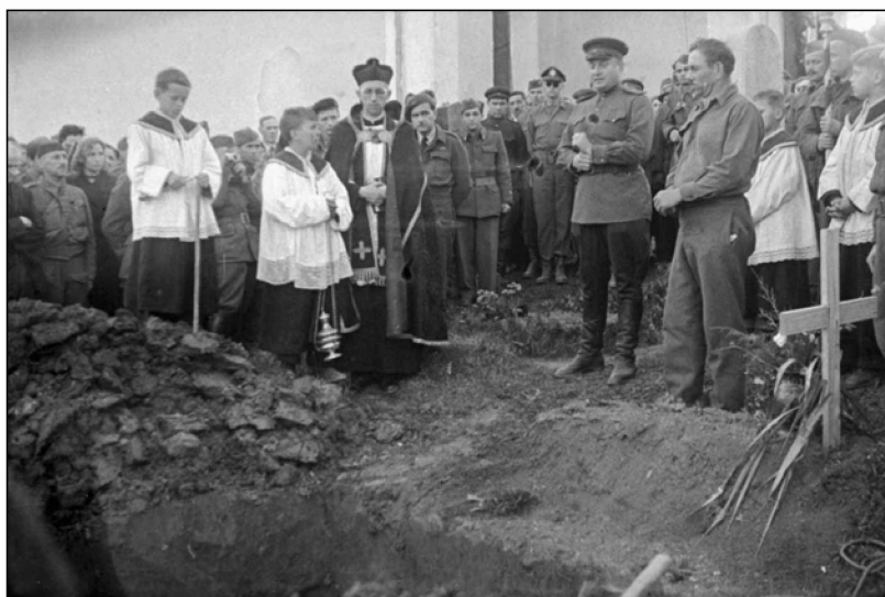
Pogreb ponesrečenih ameriških pilotov, Vojna vas pri Črnomlju, 2. april 1945 (MNZS)