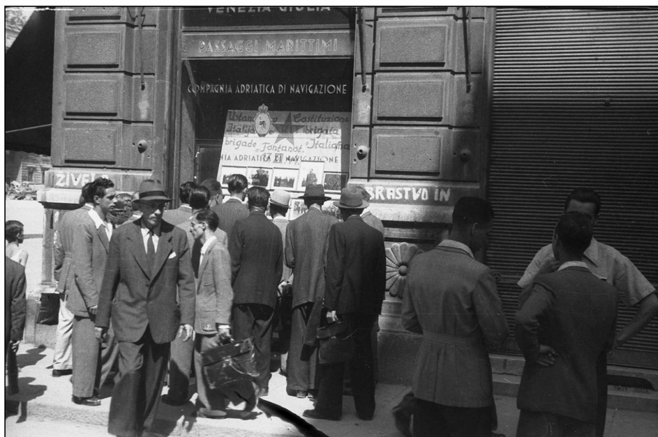
Življenje v osvobojenem Trstu. Tržačani si ogledujejo v izložbi partizanske fotografije, 4. maj 1945