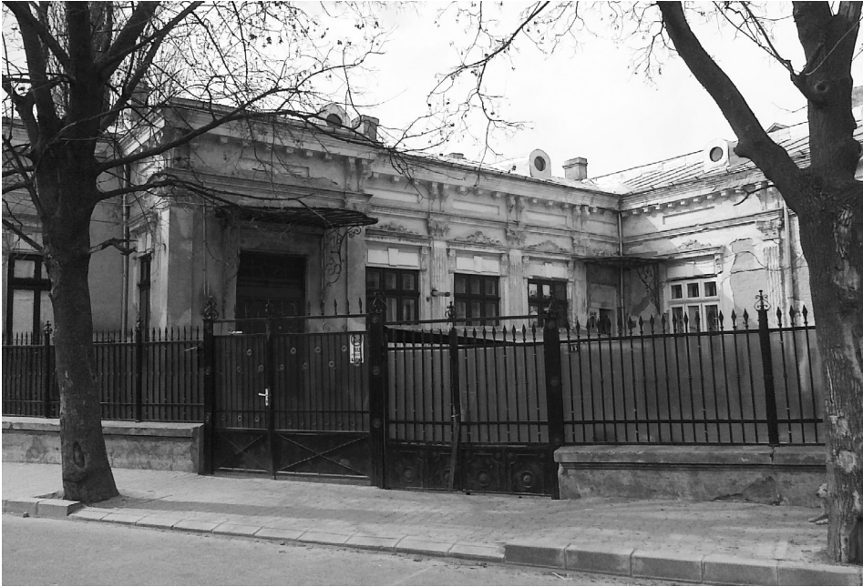
Slika 2: Stavba nekdanjega jugoslovanskega kraljevega konzulata v Braili