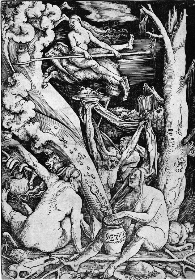
Slika 2: Čarovniški sabat (Hans Baldug Grien, lesorez 1510)