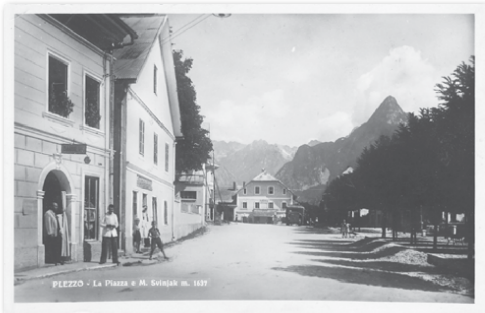
Slika 2: Bovec – glavni trg s parkom