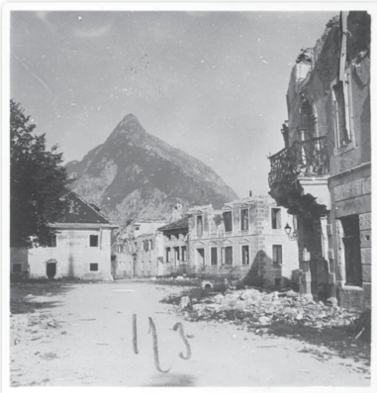
Slika 1: Bovec v ruševinah