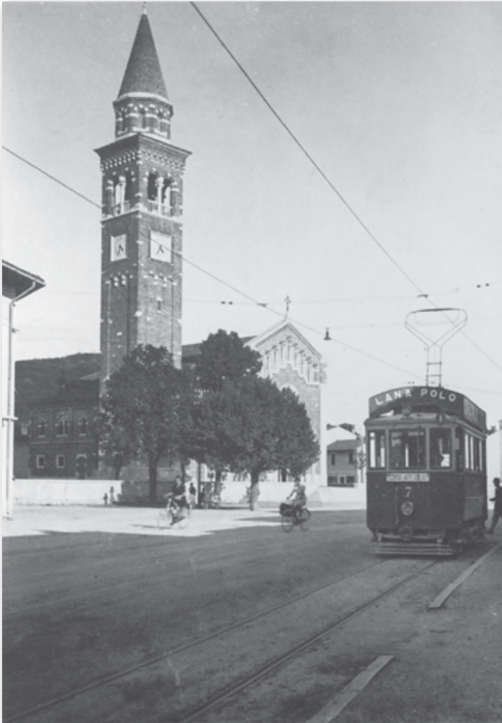
Slika 4: Šempeter pri Gorici - obnovljena cerkev in glavna ulica, 1933

Vir: SI PANG/0583, Zbirka fotografij, a. e. 41, št. 6 (originalne hrani Goriški muzej)