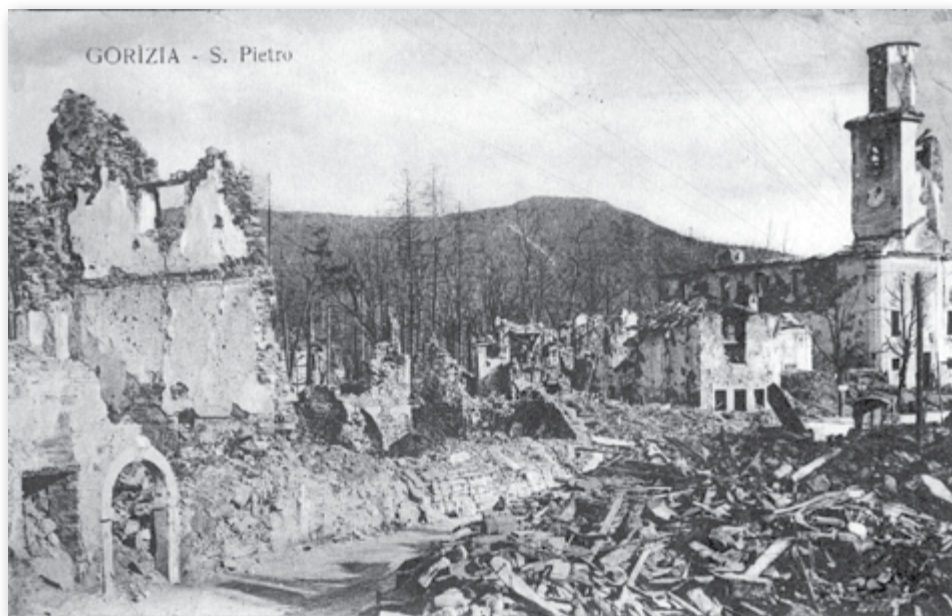
Slika 3: Šempeter pri Gorici - porušena glavni trg in cerkev Sv. Petra