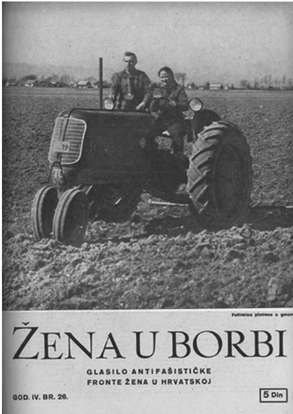
Traktoristka na naslovnici revije Žena u borbi