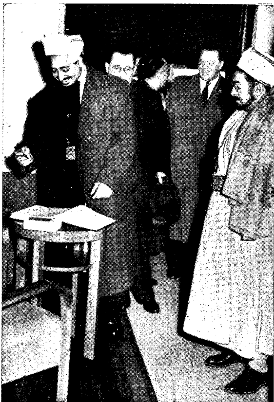
Jemenski prestolonaslednik princ Seif el Islam Mohaméd el Badar na obisku v Muzeju NO 26. XII. 1957