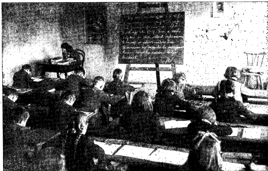
Partizanska šola v Ljubnem v Savinjski dolini jeseni 1944

vsestranskemu pritisku s tečaji se je rodil v srcih naših zavednih ljudi odpor, ki ga je še vzpodbudila velika opora s strani kozjanskih partizanov. Pravi polet in vso organizacijo pa je dala politična oblast.