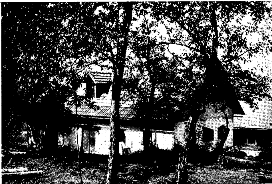
Gorenje Laze: Sobrova hiša, kjer je prenočeval del borcev