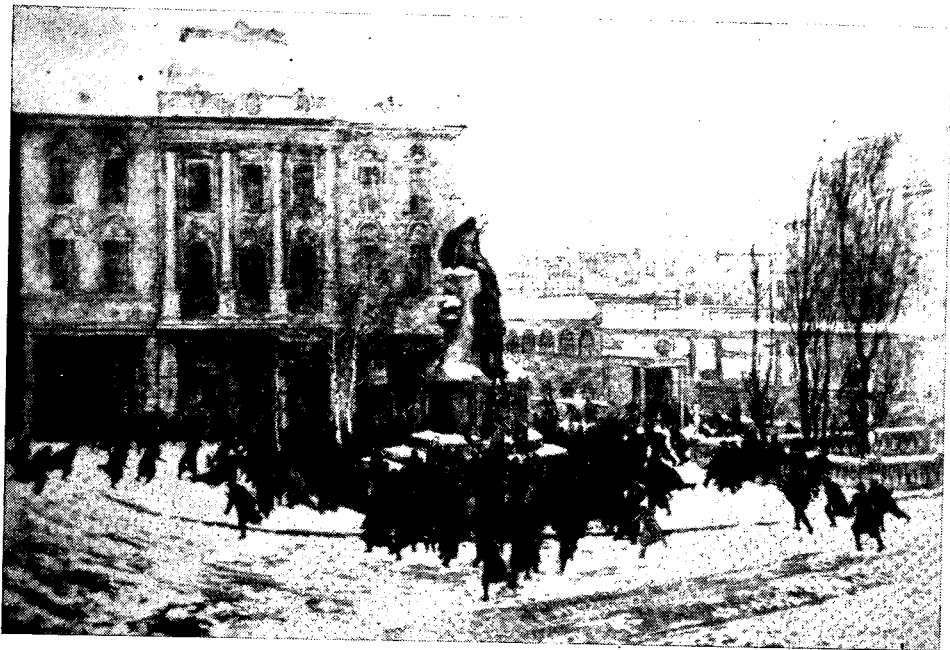
Dore Klemenčič — Maj. Mladinska komemoracija pred Prešernovim spomenikom v Ljubljani 8. febr. 1942 Olje, 1955, reprodukcija

V Novem mestu je borbena skupina, ki je šla potem v partizane, 170 na predvečer praznika zažgala italijansko garažo, v kateri so bili štiri avtomobili in dve motorni kolesi. Vojski in gasilec se je sicer požar posrečilo pogasiti, vendar je bilo za približno 20.000 lir škode. 171