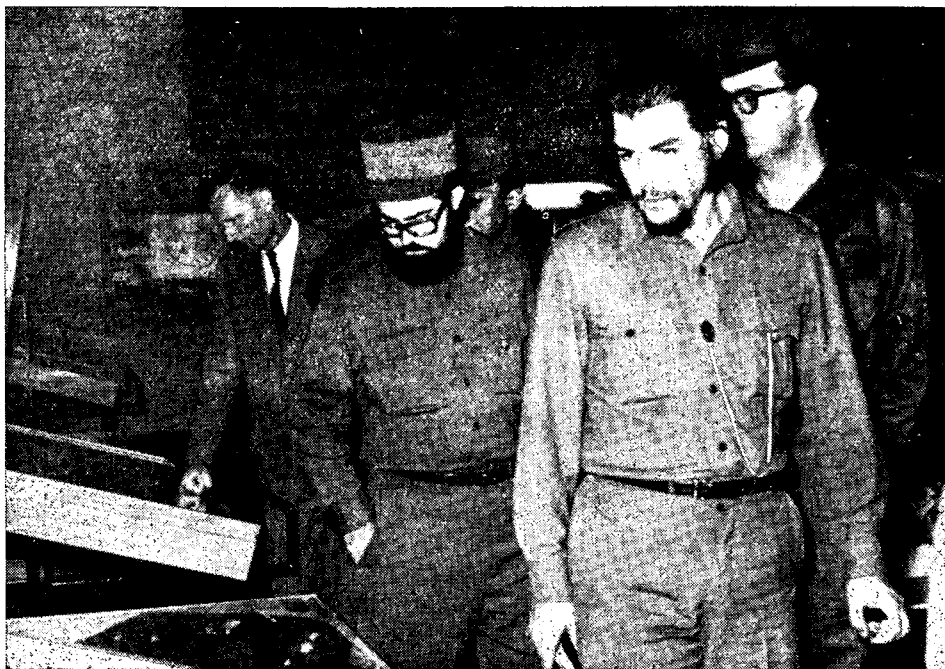
Muzej narodne osvoboditve LRS v Ljubljani. Obisk kubanske misije dobre volje 20. avgusta 1959

Inštitut ima več oddelkov in služb, dokaj številno osebje, prostore pa v treh različnih poslopijih. Njegovi glavni oddelki so zgodovinski, arhivski, muzej narodne osvoboditve, knjižnica in konservatorski oddelek.