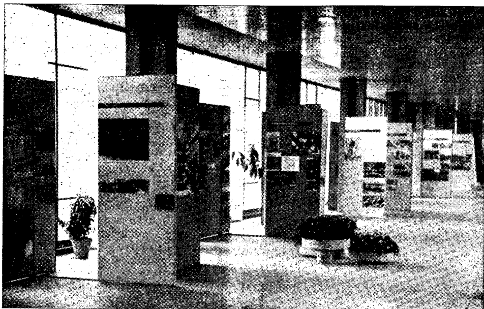
Razstava »40 let KPJ« v Ljubljani. Razstavni panoji v prostorih Gospodarskega razstavišča

zanskih grafikah, ki so tudi nujno potrebne zaščite. Nekateri teh dokumentov so taki, da bi jih čez nekaj let ne bilo več mogoče rešiti.