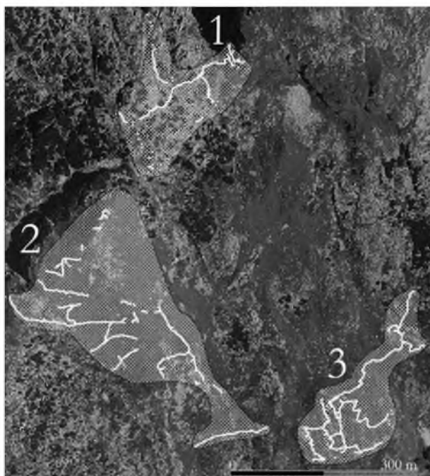
Slika 2. Obravnavana območja za terensko raziskavo. Območje 1 – sedlo med Čukljo in Rombonom; območje 2 – Čuklja; območje 3 – Mrtvaška glava

Kaverne in platoji, kjer so stale lesene vojaške barake, so pogosto zgrajeni pod skalnimi robovi, ki na tem območju v večini potekajo v smeri sever – jug in severozahod – jugovzhod. Takšna umestitev v prostor je omogočala, da so bile skrite pred pogledi iz avstro-ogrske strani in verjetno varne pred nasprotnikovimi topovskimi izstrelki. Bolj nevarni so jim bili minometni izstrelki, ki so zaradi strme krivulje leta prileteli na tla veliko bolj navpično, terenske najdbe ter podatki iz dokumentarnih virov pa pričajo o prisotnosti različnih tipov minometov na obeh straneh. Tudi poti so bile speljane pod skalnimi robovi, kar je omogočalo maskiranje in zaščito. Strelski in povezovalni jarki so prav tako lahko vkopani ob skalnih robovih, kjer nekoliko obklesani skalni rob ponavadi predstavlja hrbtno stran jarka, druga stranica jarka pa je ponavadi zgrajena iz zloženega kamenja. Na robovih jarkov so bile verjetno naložene tudi vreče s peskom in postavljene oklepne plošče s strelnimi linami. Pred položaji si lahko predstavljamo tudi širok pas žičnih ovir, kar je bila stalna praksa takratne vojaške doktrine. S tega dela bojišča so italijanski vojaki lahko z boka stre-