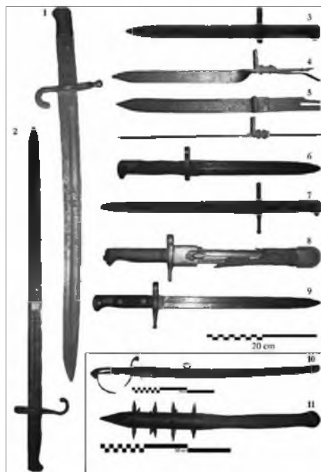
Slika 9. Hladno orožje