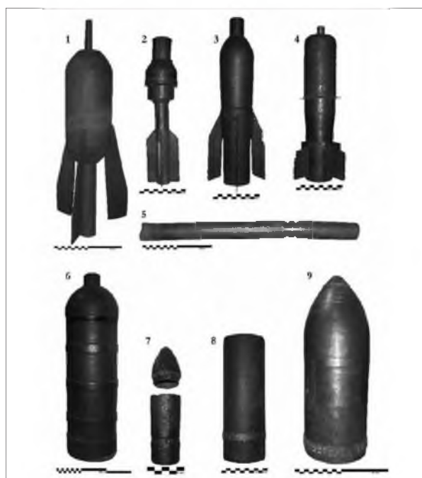
Slika 8. Minometno in topniško strelivo