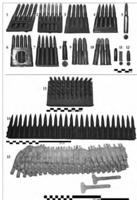
Slika 7: Strelivo za pehotno orožje