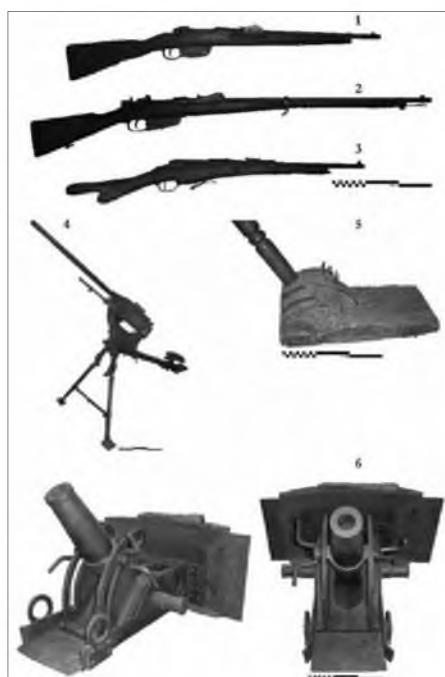
Slika 6. Strelno orožje