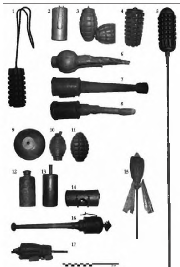
Slika 10. Ročne bombe in tromblonske mine