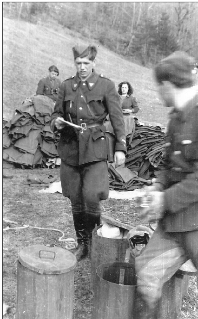
Partizanski oficir pri pregledu zavezniške pomoči iz zraka v Zgornji Savinjski dolini leta 1944.