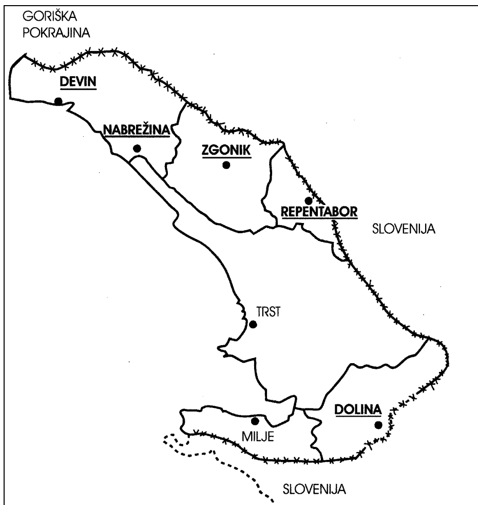
Zemljevid 2: Današnja Tržaška pokrajina.

V: Caduti, dispersi e vittime civili della regione Friuli-Venezia Giulia nella seconda guerra mondiale, Tržaška pokrajina, 4. knjiga, Videm 1991.