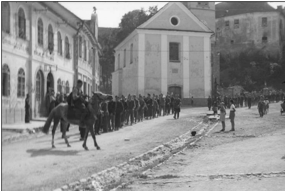
Tretji bataljon Gubčeve brigade ob kapitulaciji Italije, Mokronog, september 1943 (MNZS)