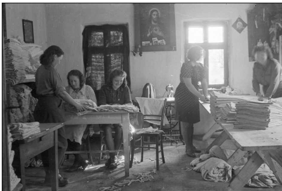
Krojaška delavnica pri Tajnerju v Črnomlju, 22. oktobEr 1944 (MNZS)