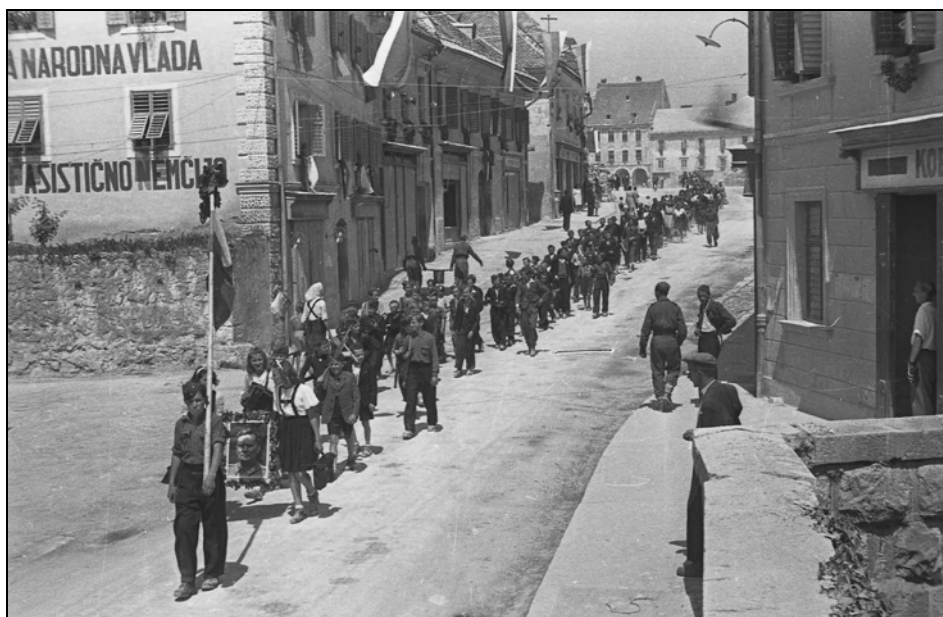
Osvoboditev Celja, 10. maj 1945 (MNZS)

Živel je z Danico Kaše, materjo znanega slovenskega fotografa Egona Kašeta, ki je v petdesetih letih živel z njima. Kaše se spominja Zupančiča kot dobrega in inventivnega fotografa. Maksimilijan Zupančič je poznal je veliko ljudi. Kaše ga je večkrat spremljal, ko je fotografiral številna slavlja in dogodke. Pravi, da je bilo samo po sebi razumljivo, da je tudi sam postal fotograf. 20 Zupančič je bil po besedah Egona Kašeta pri strankah cenjen, zato je imel več dela kot drugi fotografi. Če je imel večjo skupino ljudi, je zaradi kakovosti posnetka slikal na steklene plošče formata 10 x 15 in 13 x 18 cm. Sam je izdeloval steklene plošče po kolodijemskem postopku malo pred fotografiranjem (portretiranci so morali stati na miru), tako da je