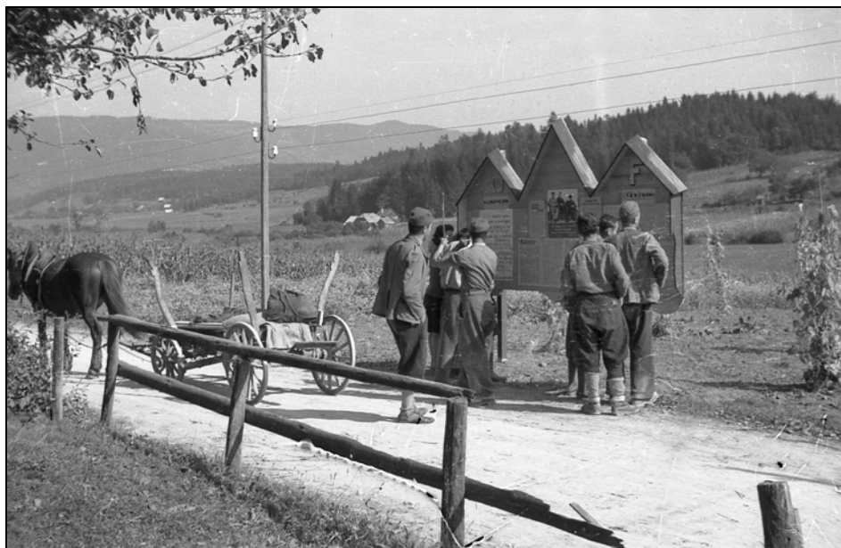
Stencas in oglasna deska propagandnega odseka okrožja OF Novo mesto, september 1944