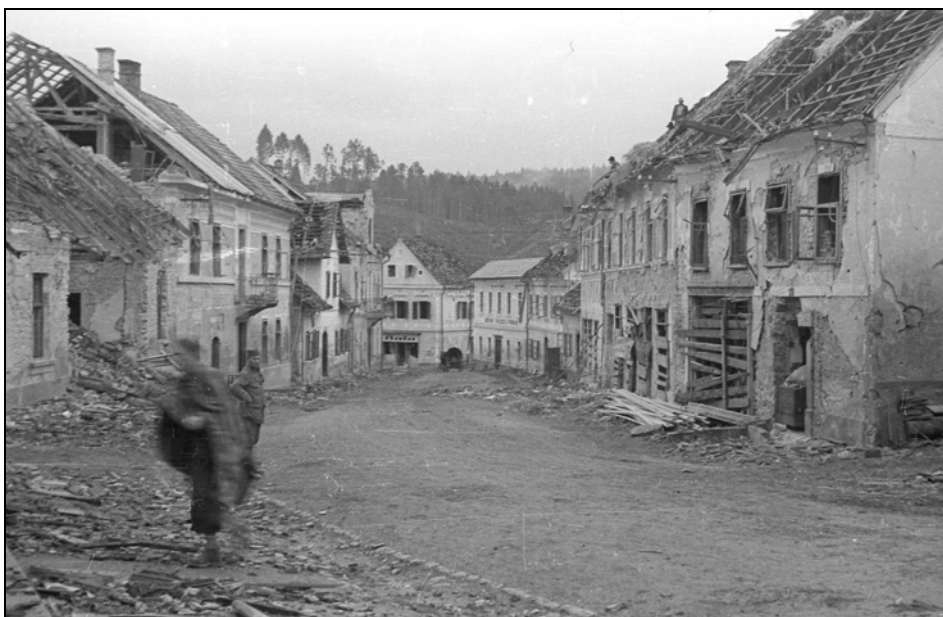
Ruševine po nemškem bombardiranju Mokronoga, september 1943 (MNZS)