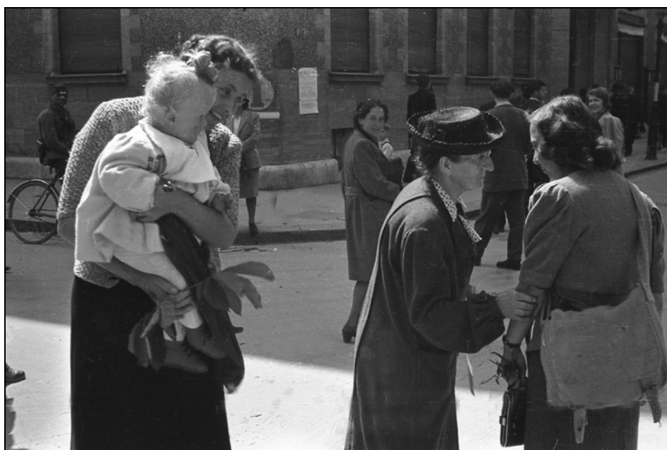
Prizor iz Ljubljane, 10. maj 1945 (MNZS)