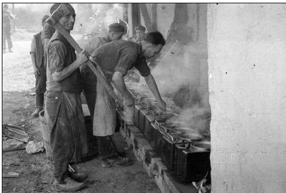
Kuhinja Cankarjeve brigade, 21. september 1943