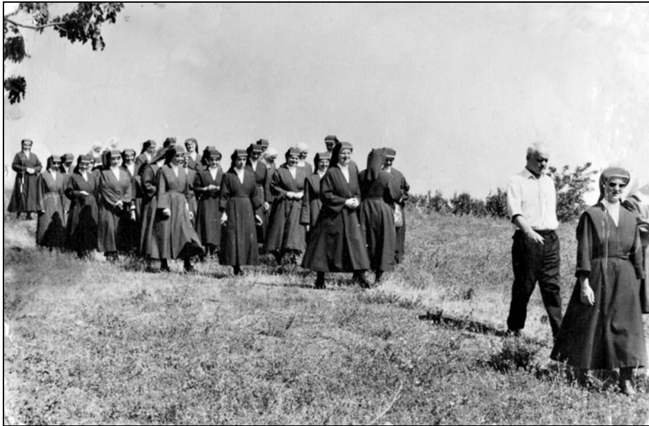
Sestre usmiljenke iz Beograda gredo na obisk k pravoslavcem v njihov samostan na Fruški gori, 1969.