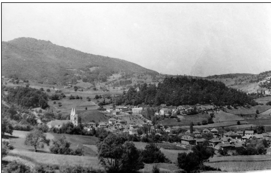
Vas Letnica na severu Kosova s cerkvijo posvečeni Mariji, center duhovnega in družabnega življenja v vasi in zelo priljubljena romarska točka.