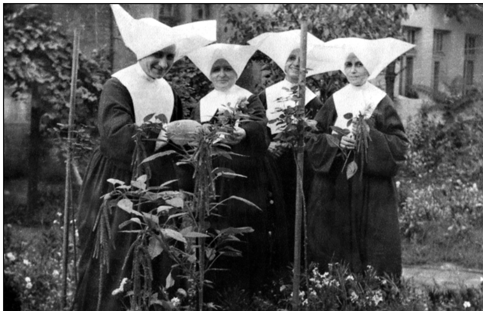
Sestre usmiljenke na vrtu, ulica Kneza Miloša v Beogradu, 1959.

manja in izdelovanja fotografij je bilo vse več. Najprej je dala razvijati filme in izdelati fotografije znanemu beograjskemu fotografu, a ko mu je povedala, da se je ukvarjala s fotografijo, je leta 1963 predlagal njenim predstojnikom, da ji opremijo temnico in kupijo fotografsko opremo, kar so tudi storili, saj je bilo vse več zahtev po fotografskih storitvah. Po drugi strani pa so bili zelo zadovoljni z njenimi fotografijami. Poleg dela v otroški bolnišnici v Beogradu je bila zaposlena še s fotografiranjem. Bila je zelo srečna, da je opravljala dva poklica.