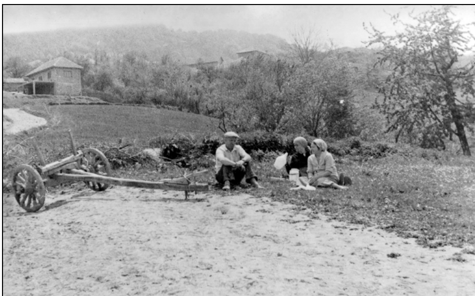
Kosovo, Letnica – počitek po delu na polju, 1987.

Kljub občutku, da se je ustavil čas, pa se je ob prihodu sestre Hermine tudi Letnica že začela spreminjati. Mladi fantje in možje so začeli hoditi delat v Zahodno Evropo, s prisluzenim denarjem zidati hiše in stare iz blata podirati. Življenjski standard se je začel izboljševati z odprtjem nove ceste. Zato so dokumentarni posnetki sestre Hermine toliko bolj dragoceni, saj je s fotoaparatom beležila posebnosti in način življenja, ki ga na tem prostoru ni več tudi zaradi tragične vojne v devetdesetih letih v Jugoslaviji, ki je zaradi strahu pred srbskim militantnim nacionalizmom iz domov v Letnici pregnala večino Letničanov na Hrvaško. Tako se je končalo 300-letno bivanje Hrvatov iz Dalmacije na tem zaprtem območju. Teh ljudi in načina njihovega življenja ni več. Ostali so le dokumentarni posnetki sestre Hermine za zgodovino. 20