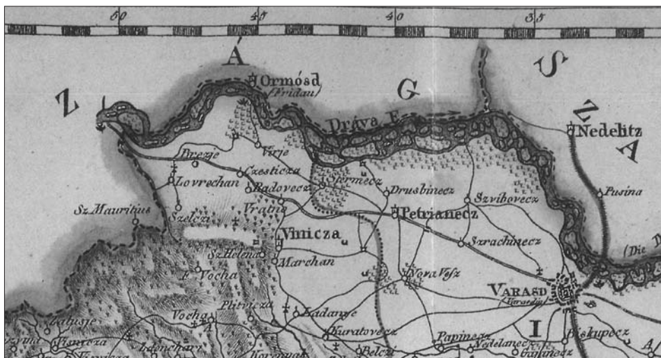
Valentić, Mirko et al. (ur.). Hrvatska na tajnim zemljovidima 18. i 19. stoljeća. Varaždinska županija. Oris terena . Zagreb, 2005

ni). Vse to je sprožalo nezadovoljstvo med dotičnim prebivalstvom, na drugi strani pa puščalo deželno mejo pravno neuskkljeno.