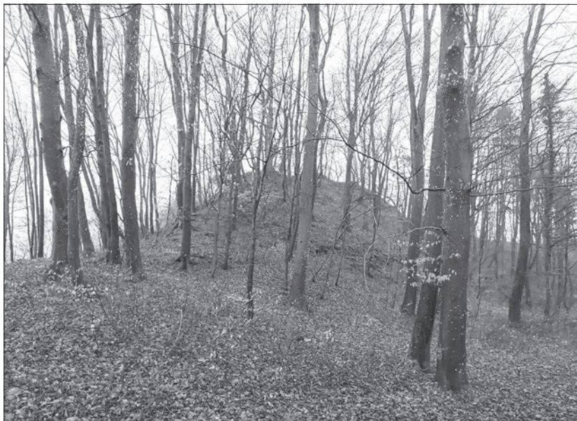
Od gradu Dobrenj ni ostalo skoraj nič, opazna je le nekoliko spremenjena konfiguracija terena.