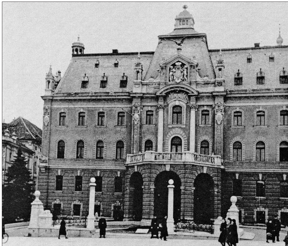
Spominsko ploščo je mogoče prepoznati na številnih fotografijah univerzitetne palače iz časa med svetovnima vojnoma kot bel pravokotnik sredi parka pred poslopjem.

akademiki privadijo medsebojni strpnosti, v kolikor se pri takih stvarih ne moti redno poslovanje univerze». 80