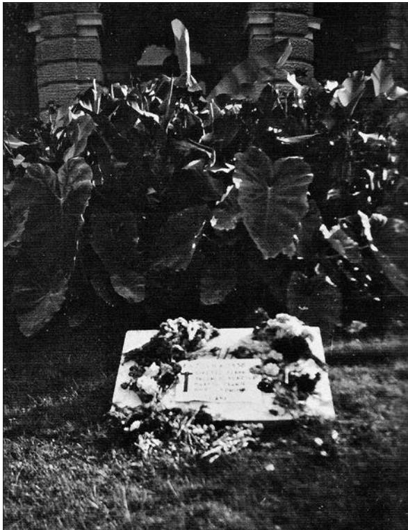
Edina znana fotografija plošče je nastala ob komemoraciji v spomin na bazoviške žrtve, katerih imena so napisana na papirju, položenem čez ploščo (foto: Fototeka Odseka za zgodovino pri Narodni in študijski knjižnici v Trstu, reprodukcija po: Pahor, Bazovica, str. 48).

narod je o prvi žalni svečanosti leta 1930 zabeležil: »Nekaj posebnega smo videli letos na praznik vseh mrtvih pred ljubljansko univerzo. Naši akademiki so pokazali, kako globoko spoštujejo spomin narodnih žrtve in kako znajo ceniti za veliko idejo doprinešene najtežje žrtve. Pred univerzo so bili položeni krasni vencji in šopki, med katerimi so gorele številne sveče. Molče so prihajali akademiki in polagali rože na ta nemi simbol naše bolesi.« 106 Jugoslovan je menil, da je bila oddolžitve petim žrtvam skromna, toda ganljiva: »Na rapalski plošči pred univerzo smo jim prižgali svečke upanja in nade na rešitev ter obsuli njih imena s krizantemami. Mimo smo hodili in se ozrli na brleče svečke in ni bilo očesa, ki ne bi pri tem oroselo. Otirali smo si solze vsi, ki smo odhajali od tega mesta.« 107 Naslednje leto so na