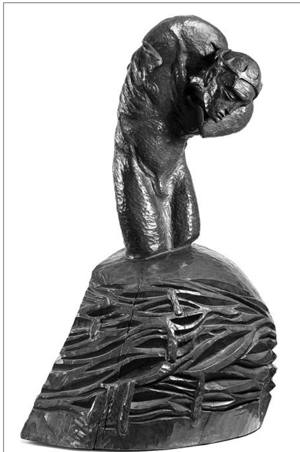
Bolest Slovenije , osnutek za spomenik zasedenemu ozemlju Toneta Kralja (1921).

Izkazalo se je, da je odgovor na to vprašanje nikalen. Kljub različnim idejam in zasnovam je preprosta