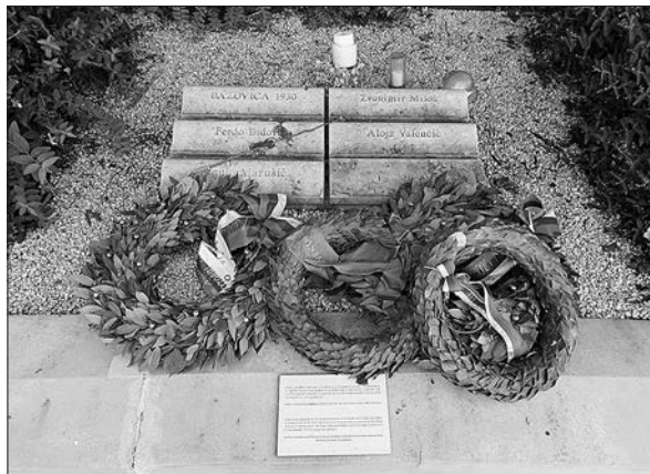
Spominsko obeležje bazoviškim žrtvam pred univerzo septembra 2022.