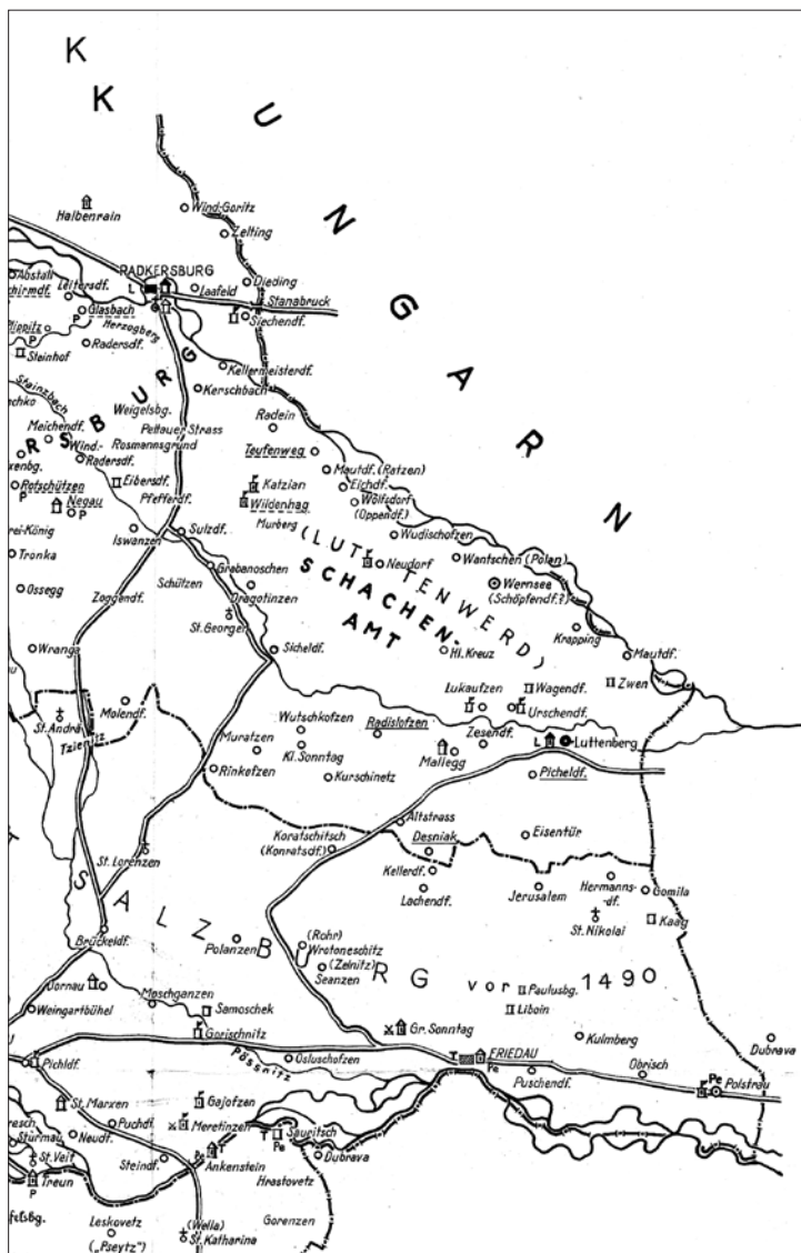
Gospodstva in imenja na Ljutomerskem na prelomu iz srednjega v zgodnji novi vek (Pirchegger, Die Untersteiermark, karta v prilogi v zavihku na zadnji platnici – izsek: del karte s stanjem na območju med Muro in Dravo; https://de.wikipedia.org/wiki/Datei:Untersteiermark_Schema_der_Grenzen_und_Besitze.jpg ).

Svetokriževski vikariat pa je po Kovačiču takrat obsegal 21 krajev: Banovci, Boreci, Bučecovci, Bunčani, Gajševci, Grabe pri Ljutomeru, Grlava, Hrastje, Iljaševci, Ključarovci pri Ljutomeru, Kokoriči, Krištanci, Sv. Križ (Križevci), Logarovci, Lukavci, Mota, Nova ves, Stara ves, Šalinci, Veržej in Vučja vas. Tudi ta obseg se do ustanovitve jožefinskega vikariata Veržej ni spreminjal. 13